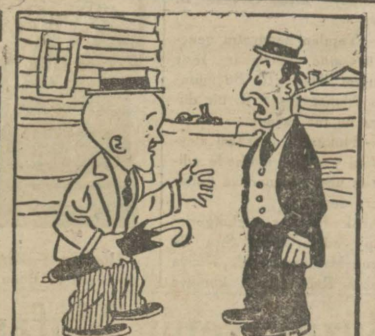
4 : Hasan B. — Eğer herkesi açık söylemekten menederseniz böyle gizli gizli konuşurlar, ne söylediklerini ne sen anlarsın, ne de ben!