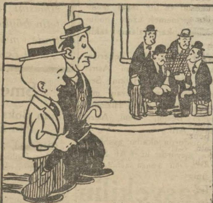
2 : Vekil — Hasan Bey... Bak, şurada da üç dört kişi "fıs, fıs, fıs" birşey söylüyorlar.