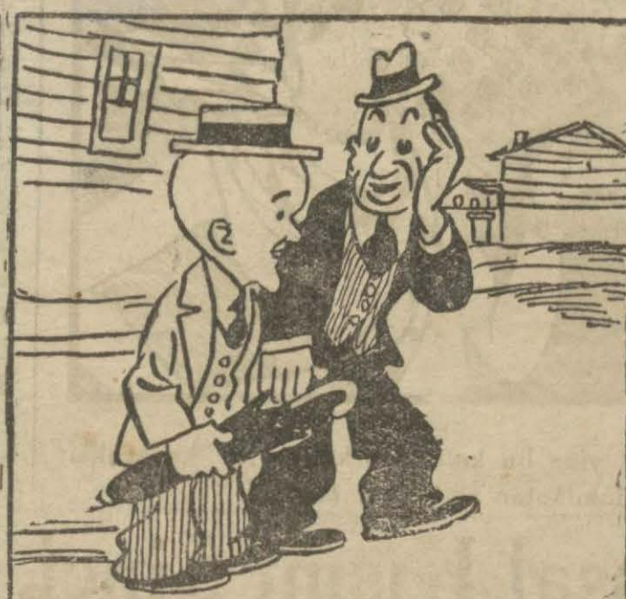
3 : Vekil — Ne konuşuyorlar acaba? Alehimize birşey mi söylüyorlar? Ne dersin?