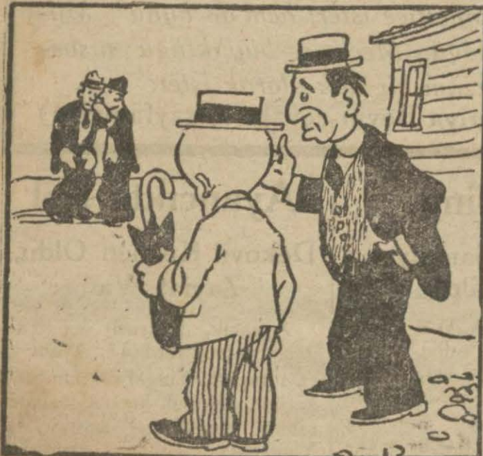
1 : Vekil — Hasan Bey... Şurada iki kişi kulaktan kulağa birşey fısıldıyorlar, bak!